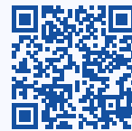
Déterminant et colinéarité

Exercice. \vec{u} \begin{pmatrix} -2 \\ 3 \end{pmatrix} et \vec{v} \begin{pmatrix} 4 \\ -6 \end{pmatrix} . Calculer \det(\vec{u}, \vec{v}) .